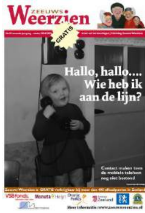
Nr 23: Communicatiemiddelen

Iedere nieuwe editie van de krant is vergezeld van een aankondigingsposter , waarop tevens de subsidiegever en sponsors zijn vermeld. Omdat de productie van de krant vanaf maart 2025 niet meer wordt ondersteund door subsidie of fondsen, is deze vermelding gestopt. De poster wordt ontworpen door onze vrijwillige vormgever en meegeleverd met de kranten, zodat deze op de distributielocaties ter aankondiging van een nieuwe editie kan worden opgehangen.