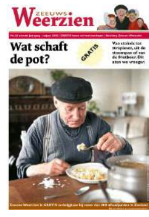
Nr 26: Wat schafte de pot