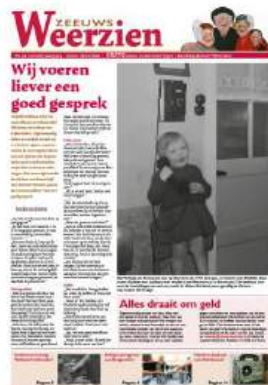
Nr 23: Communicatiemiddelen

In 2025, de zevende jaargang van Zeeuws Weerzien, is de herinneringskrant viermaal verschenen: in januari, april, juli en oktober. Voor het eerst is geen editie in december, maar in januari uitgebracht. Dit omdat de krant in december op veel afhaalpunten niet lang genoeg beschikbaar bleef doordat met name winkels en bedrijven in deze maand ruimte nodig hebben voor displaymateriaal voor de feestdagen.