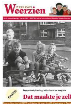
Nr 25: Dat maakte je vroeger zelf