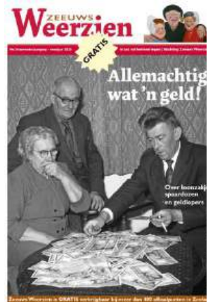
Nr 24: Betaalmiddelen