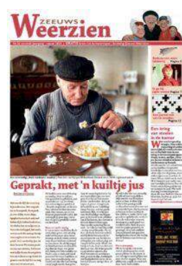
Nr 26: Wat schafte de pot