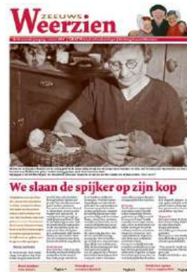
Nr 25: Dat maakte je vroeger zelf