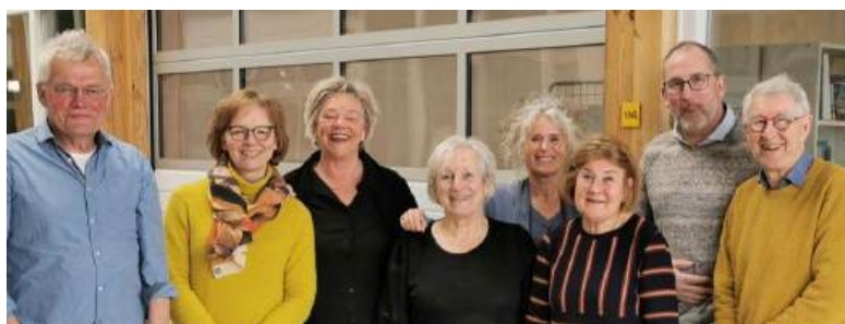
Partners van het eerste uur, v.l.n.r.

In maart 2025 kwam de financiering rond voor het project 'Samen Sterk voor Zeeuwse Senioren', een samenwerkingsverband tussen zes vrijwilligersorganisaties in Zeeland die zich met hun dienstverlening en activiteiten richten op oudere inwoners van Zeeland, met name ouderen die nog thuis wonen. Het betreft Stichting Vier het Leven, Humanitas Zeeland, Zeeuws Verlies, Stichting De Luisterlijn, Resto van Harte en Stichting Zeeuws Weerzien. Als partners willen wij door bundeling van krachten meer bereiken op het gebied van uitbreiding van naamsbekendheid, dienstverlening aan ouderen, werving en training van vrijwilligers, crowdfunding en andere vormen van fondsenwerving. Met hulp van Origin Marketing en een extern adviseur is een uniek driejarig ontwikkelplan opgesteld. Stichting Zeeuws Weerzien is initiatiefnemer en penvoerder van dit project. De krant Zeeuws Weerzien wordt tevens ingezet als communicatiemiddel om ouderen in Zeeland te bereiken.