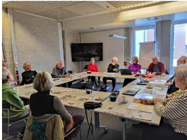
De redactie vormt een hecht team. Veel redactieleden hebben er de lange reis voor over om aanwezig te zijn bij de vergaderingen in de bibliotheek in Middelburg. Samen worden nieuwe thema's gekozen en de invulling van de volgende editie besproken.