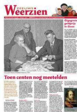
Nr 24: Betaalmiddelen