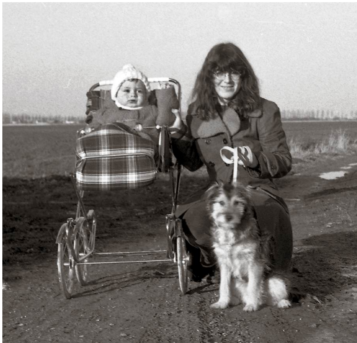
Boefie, de wollige surprise, werd liefdevol opgenomen in ons jonge gezin.

en vlees van de slager. 'Boefie' vonden we wel een mooie naam. Het paste bij z'n karakter. Hij luisterde voor geen meter. We wandelden graag in de polder. Zonder leiband kon best dachten we. Nou niet dus. Boefie liep ijskoud de andere kant op.