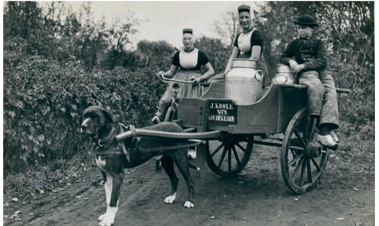
Prentbriefkaart van een Walcherse hondenkar uit 1915 | Foto: A. van Agtmaal ZB/Beeldbank Zeeland, rec. nr. 31962

Maar zware lasten trekken of torsen is er niet meer bij. Tot