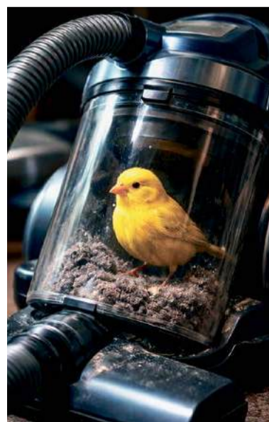
Foto: gemaakt met AI

Want mevrouw gebruikte een stofzuiger waardoor het dier- tje een 'vreemde reis' maakte 'die waarschijnlijk enig is in de annalen van de vogelwereld.' De vogel kon de zuigkracht niet weerstaan en werd opgeslorpt door de stofzuiger. Nadat die was uitgezet, werd het vogeltje uit zijn benarde positie bevrijd. De krant meldt dat het eruit zag als een 'vogelpieterbaasje' die de lust tot zingen was vergaan.