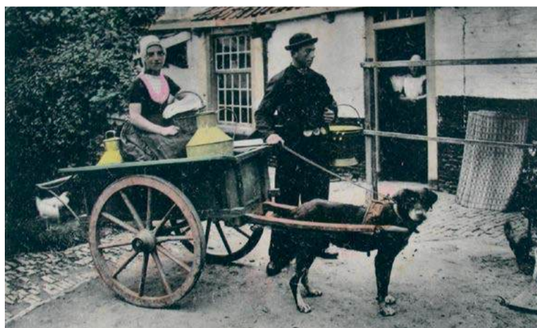
Prentbriefkaart van een Walcherse hondenkar rond 1900. | Uitgeverij F.B. den Boer, Middelburg. ZB/Beeldbank Zeeland, rec. nr. 31963

1962 was het gebruik van hon- den als trekdier wettelijk toege- staan, al was het wel aan regels gebonden. Daarna werd er alleen nog ontheffing gegeven voor sledehonden. Een succesje voor de Anti Trekhonden Bond die in 1912 werd opgericht en pas een halve eeuw later gehoor vond. Tot en met de jaren dertig zijn ze een vertrouwd beeld op straat. Bakkers brengen er hun waar mee rond, net als boeren die met karren met zware melkbussen