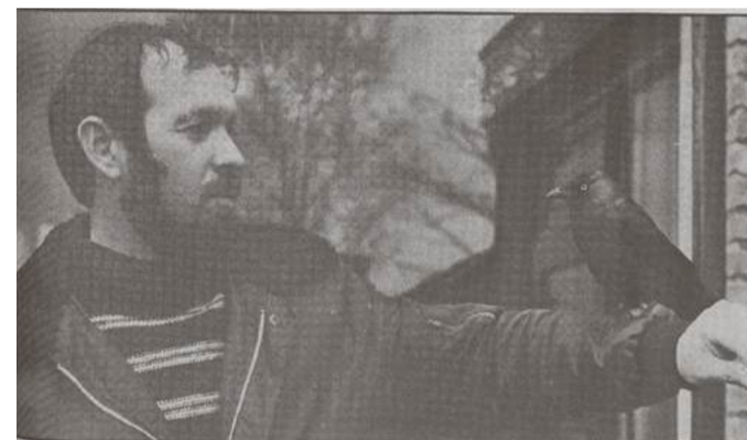
Kauwtje op de arm van zijn baasje.

Van Frayenhove plaatste een advertentie en kreeg als reactie dat hij in een schuur bij een boerderij in de omgeving zat. „Toen ik in die schuur het bekende geklik met mijn tong liet horen en er ook nog een paar keer ‘kauwtje’ achteraan riep, zat hij zo weer op mijn schouder”, vertelde de eigenaar. Zo werd hij weer de attractie van de buurt, waar hij zich te goed deed aan vlinders, rupsen, bijen en wormen. Naast het eten dat hij kreeg, zoals fruit en een stukje kaas, zijn favoriet. „Er is eigenlijk niet veel wat hij niet lust”, aldus Van Frayenhove, „hij eet gewoon met de pot mee.”