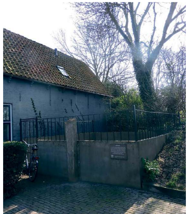
De schutskooi in Zierikzee.