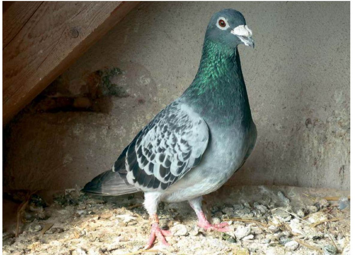
Postduif doffer.

Duivenmelkers hadden het dus niet makkelijk. In 1956 kreeg een duivenmelker in Gelsenkirchen een postduif met brief bezorgd, waarin stond dat als hij zijn zeven ontvoerde duiven wilde terugkrijgen, hij een losprijs van vijftig Mark moest meegeven aan de meegebrachte duif. De gedupeerde wendde zich tot de politie, die daarop de duif, voorzien van kleurige linten, losliet en volgde met een sportvliegtuig. De duif vloog direct naar het huis van de gijzeln-