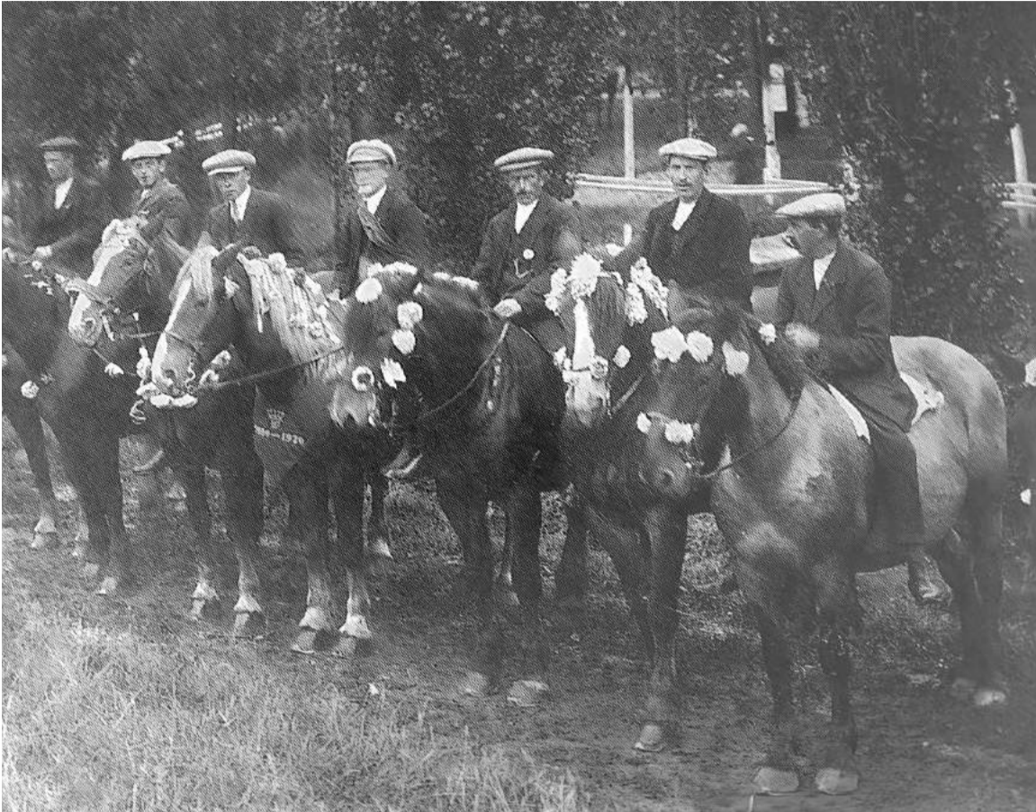
Op de foto staan Katse paardenknechten op versierde paarden opgesteld bij de Boomdijk in de Leendert Abrahamolder.