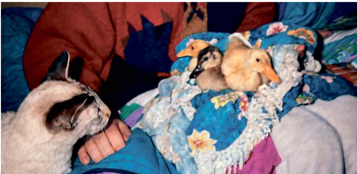
Poes Poeti kijkt belangstellend naar de nieuwe huisdieren.